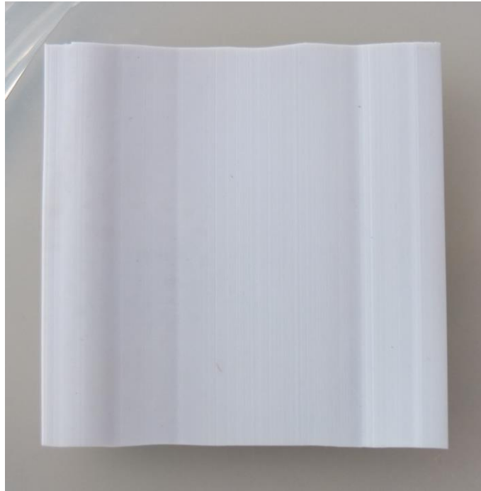
Foto 1: Untersuchungsmaterial Mekuflex Endlosbalg 80°B3, Farbe dunkelgrau nach einer Inkubationszeit von 28 Tagen ohne sichtbaren Pilzbewuchs